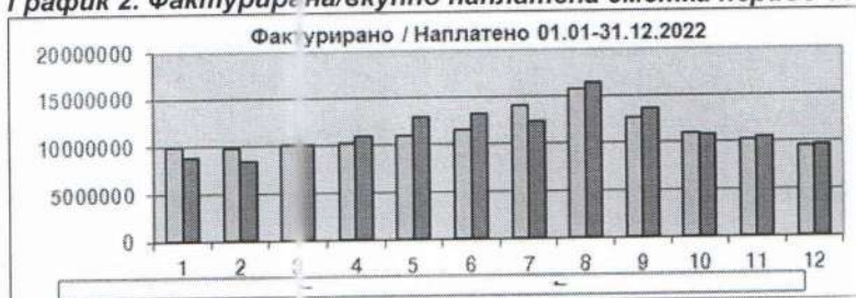
График 2. Фактурирана/вкупно наплатена сметка период 01.01.-31.12.2022