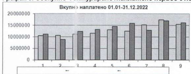
График 5. Свкупно Фактурирано /наплатено период 01.01-31.12.2022

Анализата на приложените Табели и Графикони покажува: